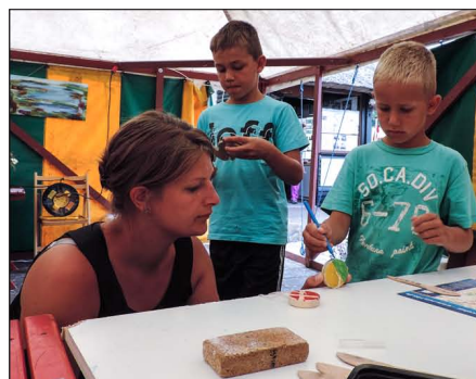
Aktivitetsskole i juli