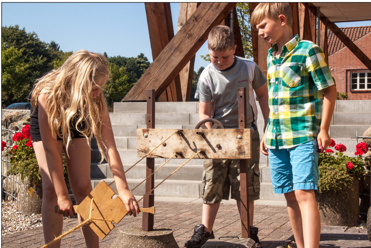
Sommeraktiviteter på Museet. Fremstilling af reb.