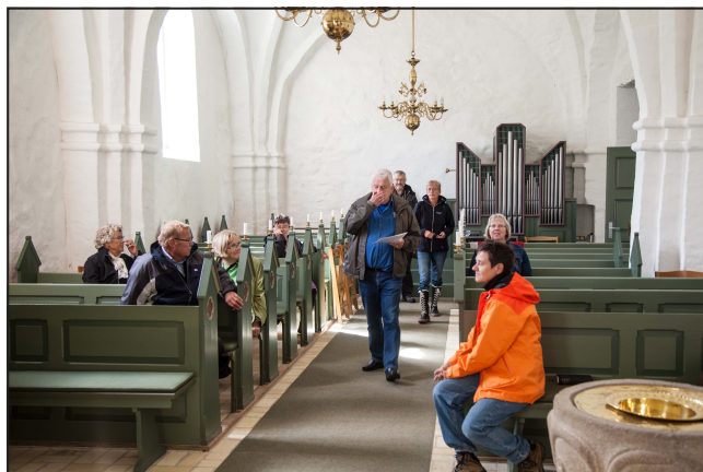
Herover: Fra turen til Tulsted kirkeruin og Thorup Kirke