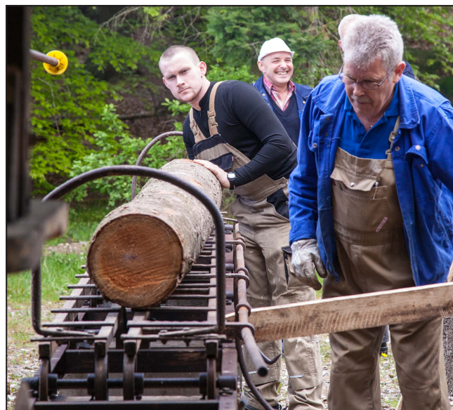
Savværkslauget demonstrerer saven