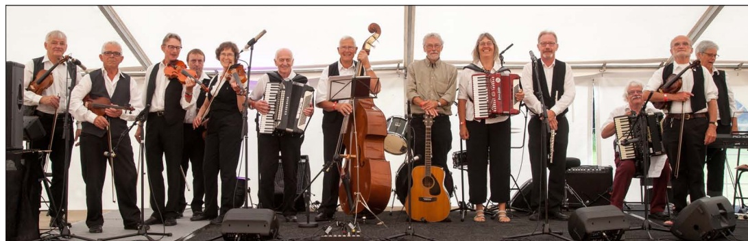
Rebild Spillemandsdrag ved folkemusiktræf i juni