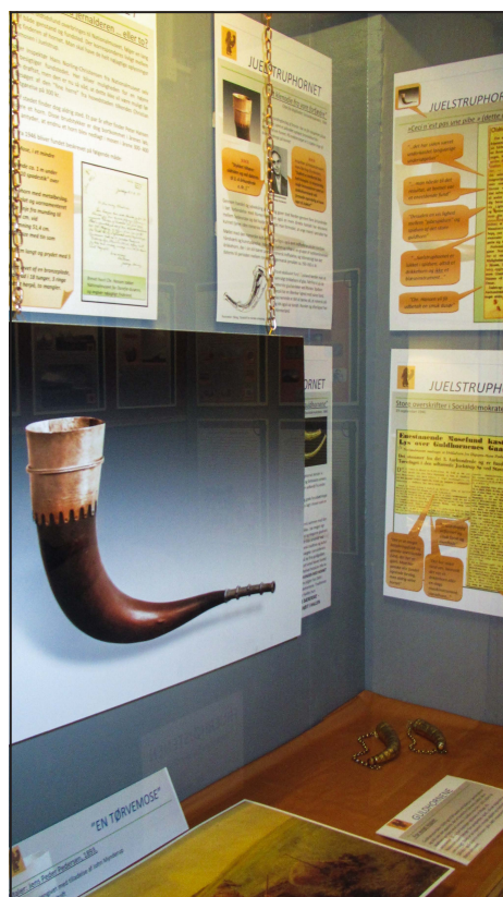
Udstilling om Juelstruphornet