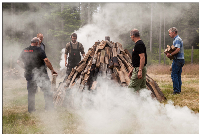
Fremstilling af trækul