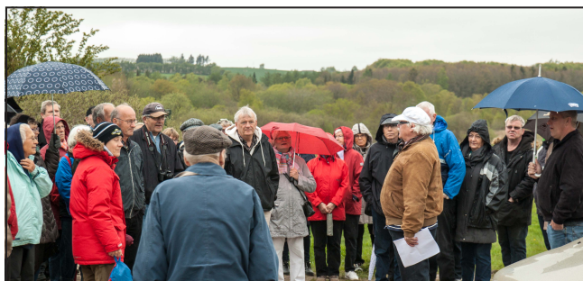
Herunder og til venstre: Tur til Egholm Borgruin