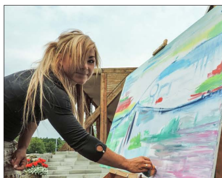
Kunstner for en dag