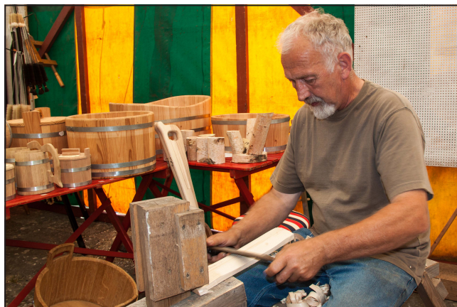
Fra aktivitetsdagene i juli