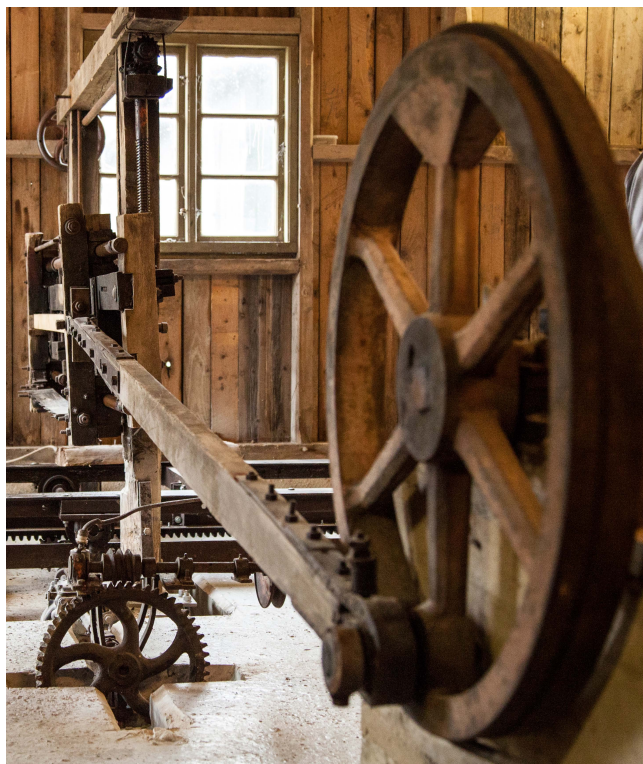
Savværkslauget er ved at opstille en gammel bloksav ved Vedsted Skovhus