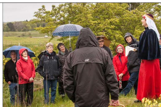
Tur til Egholm