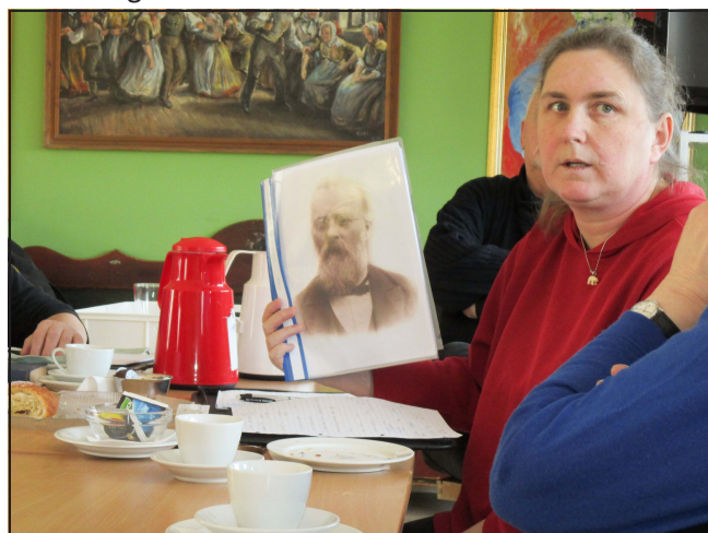
Fokus på udvandring

Museets formidling tager udgangspunkt i museets to indsatsområder, Rold Skov områdets kulturhistorie og den traditionelle folkemusik. Der bruges en bred vifte af forskellige formidlingsmetoder, nemlig permanente og skiftende udstillinger, aktiviteter og levendegørelse, undervisning af skoler, foredrag og guidede ture ud i kulturlandskabet. I nogle tilfælde rykker aktiviteterne ud af huset, eks. temadage på skoler, udstillinger i medborgerhuse o.l. Her skal omtales nogle af formidlingstilbuddene i 2014.