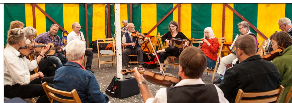
Musikværksted ved folkemusiktræf