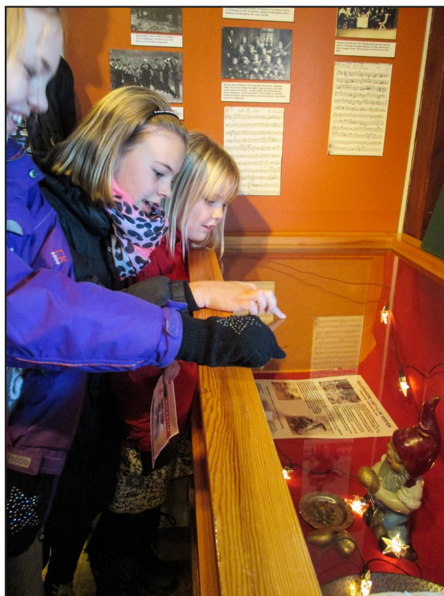
Julestue. Børnene har endelig fundet "Gode Nis"

Bliv ven med Spillemands-Jagt og Skovbrugsmuseet og vær med i den moderne kommunikation. Jo flere venner vi har, og jo flere indlæg fra os og jer – des mere dialog. – Så hop med på vognen.