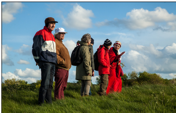
Fra turen til Egholm 1. juni