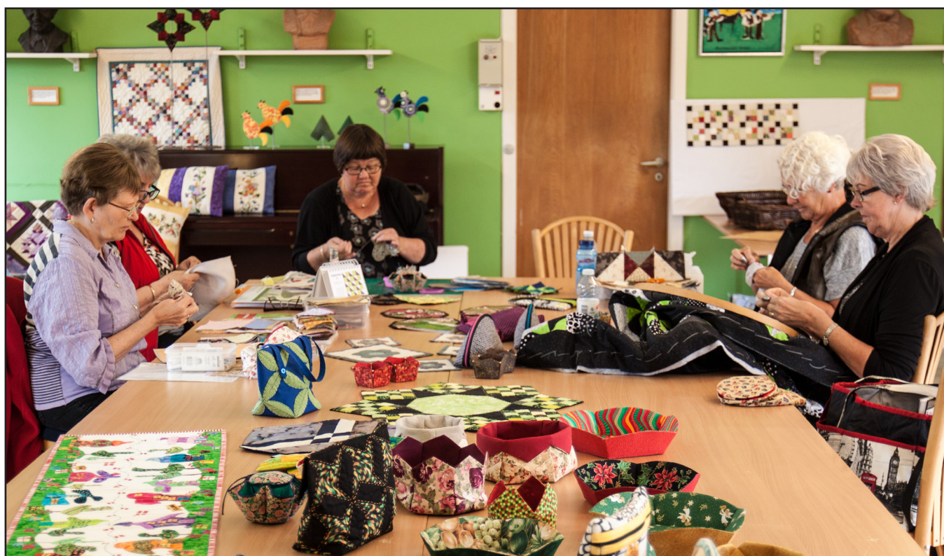
I forbindelse med Rold Skov Museernes udstilling "Nye Horisonter", om ind- og udvandring arrangerede Spillemands-Jagt og Skovbrugsmuseet to lørdage med stor Patchwork udstilling og arbejdende værksteder.