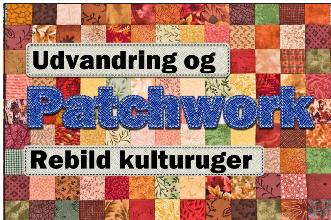
To lørdage har været afsat til fremvisning af patchwork