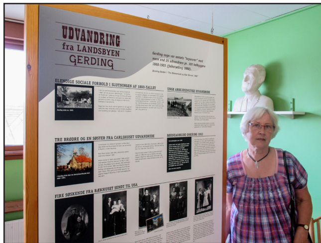
Åbningen af udstillingen "Nye horisonter" blev markeret ved en reception på Spillemandsmuseet.