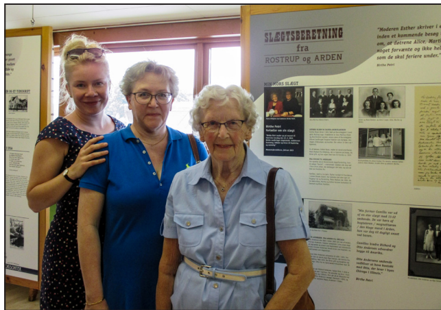
Tre generationer ved åbningen af "Nye Horisonter"