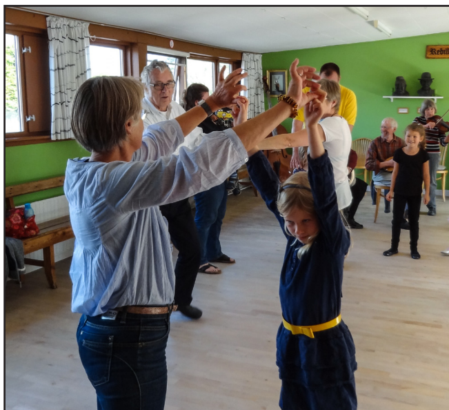
De senere år er der tilbudt familiedans den første søndag i månenden, undtagen juli og august. Her øves gamle og nyere børnedanse, i skønt fællesskab mellem børn, forældre og bedsteforældre.