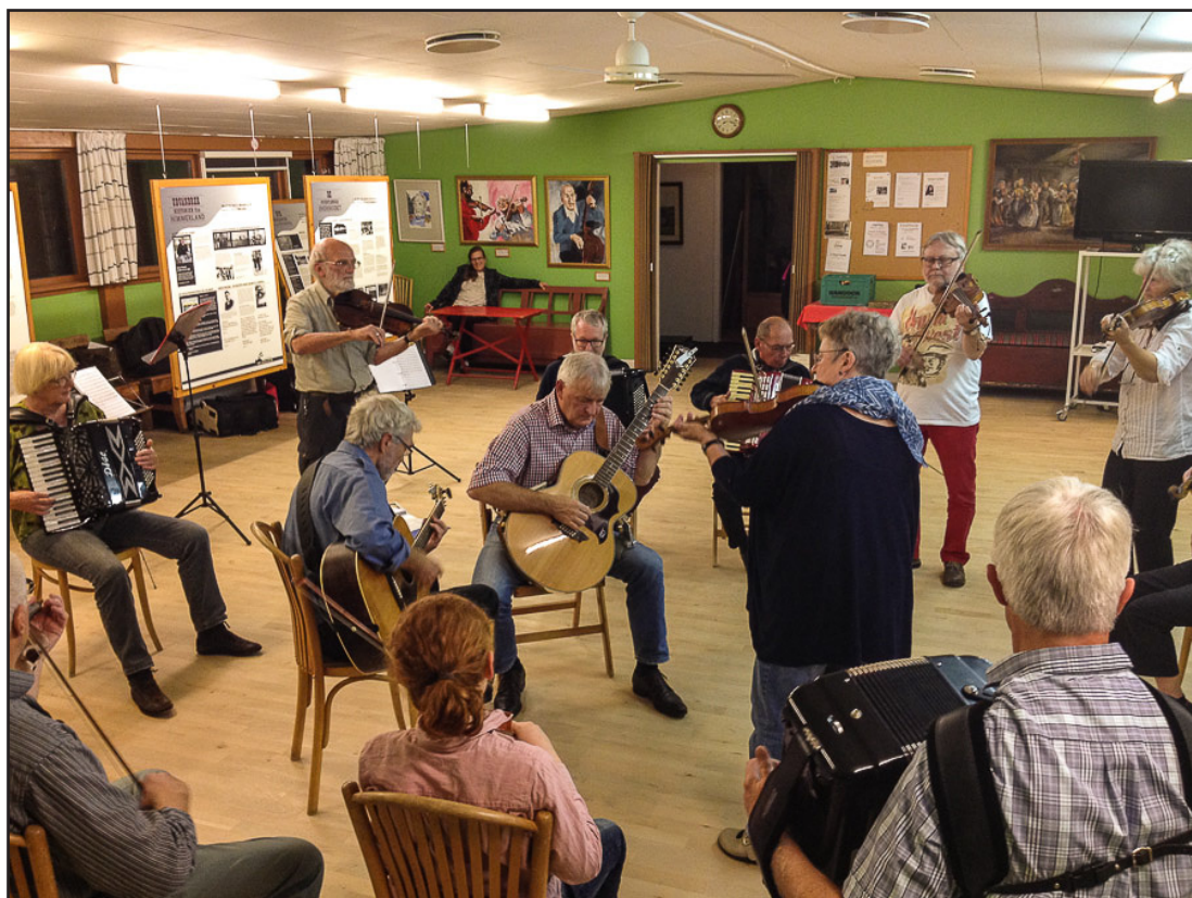
Onsdagsspillemænd til øveaften. Et af målene er at spille uden noder.

Netværket mødes bl.a. omkring fælles markedsføring – primært i Rebild og Mariagerfjord kommuner. I 2015 har museerne i fælleskab gennemført det store formidlingsprojekt, ”Nye Horisonter” – om de store danske udvandrerbølger omkr. 1860 – 1920 – men også med en flig af tidens store flygtninge-indvandrer problemer. Som det er nævnt i omtalen af formidlingsprojektet har migration ( ind- og udvandring) været en evig tilbagevendende problemstilling igennem historien. Om selve projektet ”Nye Horisonter” og dets forskellige udtryk – se under Formidling.