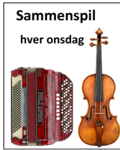
Annonce for onsdagsholdet