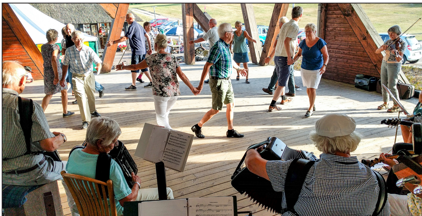
Dansere og onsdagsspillemænd i Rebildporten en lun sommeraften