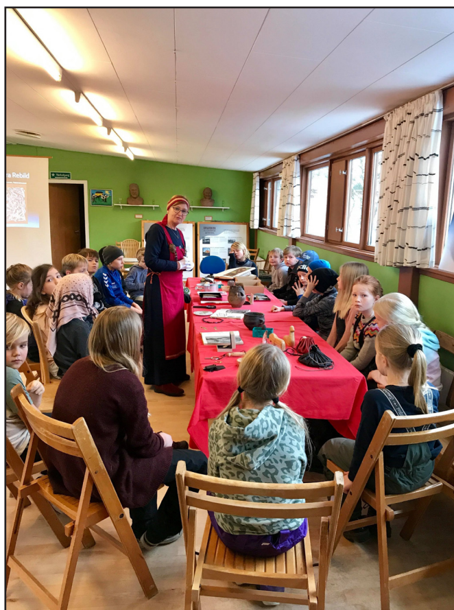
Besøg af en 3. klasse fra Skørping Skole. En hel formiddag med formidling om Danmarks oldtid og med speciel fokus på Rebild Skatten.