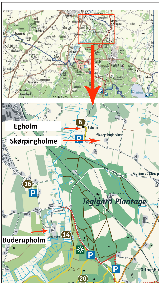
Kortet viser placeringen af de tre lokaliteter: Egholm, Skørpingholme og Buderupholm