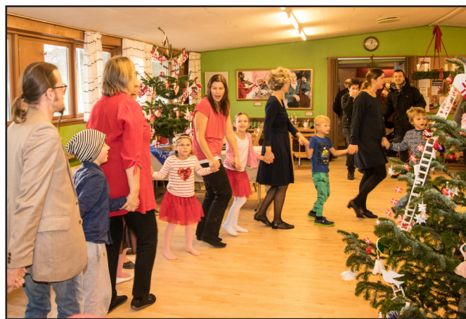
Gammel jul i Rebild

Populært var de 5 aftener med onsdagsdans, der så nød godt det gode vejr, hvor der spilles og danses udendørs på Portens store terrasse.