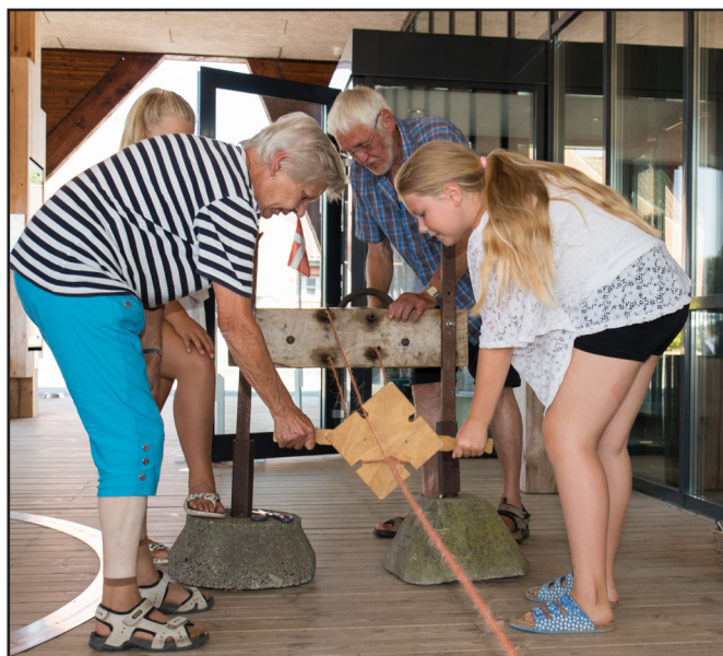
Fremstilling af reb på husflidsdagene

I løbet af sommeren afholder seniordanserne flere aftener med dans og kaffebord. I Vinterhalvåret tilbyder Rebildkvadrillen to liegstow aftener, og endelig er salen i brug til seniordans og seniorgymnastik i hele vinterhalvåret.