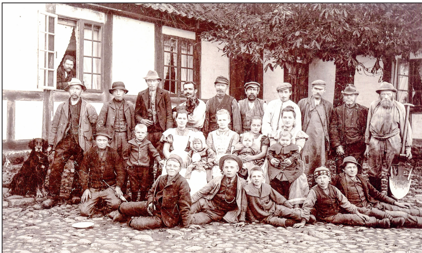
Folkeholdet på Buderupholm i slutningen af 1800-tallet. (Vi mangler navne).