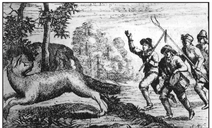
Klappere på ulvestorjagt, udstyret med både plejl, fork og tromme. Fra Tämtzer, 1682