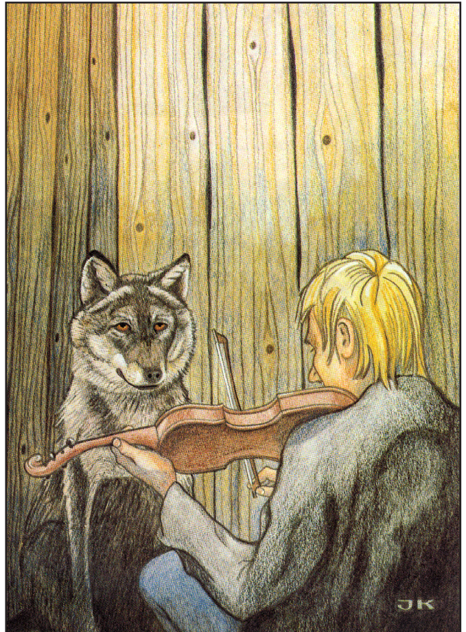
Med tilladelse fra Tidsskriftet Skalk. Illustration Jørgen Kraglund