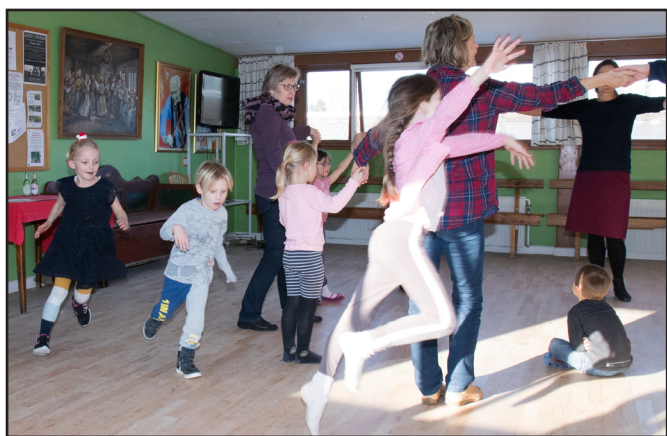
Familiedans - i fuld fart.

spil til storspillet i teltet. I husflidsteltet og i og omkring museet masser af buskspil, hvor man finder sammen i tilfældige grupper. Man kan vist roligt sige at Rebild og bakkerne denne dag var fyldt med liflig musik og underholdning.