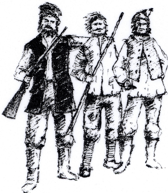
Ill.: Helge Qvistorff