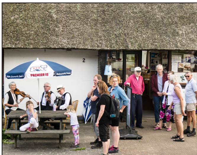
Spil og hygge mens majstangen pyntes

Majstang og Rebilfest er faste tilbud. Folkemu-siktræffet er omtalt under afsnit musik, dans og arkiv. Når det gule husflidstelt er sat ved siden af museet, er det tegn på at sommeraktiviteterne står