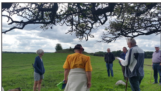
Efterårets ekskursion til Tulsted og Torup Kirke