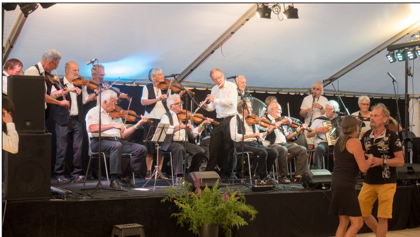
Rebildspillemandene på scenen ved årets folkemusiktræf

Årets store folkemusikbegivenhed i Rebild er det tilbagevendende ”Rebild Folkemusiktræf”, der blev afholdt den 30. juni. Som tidligere i Rebildfestens store frokosttelt, ligesom husflidsteltet og salen var inddraget. Træffet var som så mange andre arrangementer begunstiget af det flotte sommervejr, og musikken og dansen trak mange gæster til Rebild. Medvirkende i træf 2018 var: Himmerlands danse og spillemandslaug, Vestjysk Musik og dans, Op’lev harmonikavennerne, Spillemandskredsen Nordjylland, Frederiksens orkester (Als), Rebild kvadrillen og kvadrilleorkesteret, Nibe Harmonika-klub og Rebild spillemandene. Der startes kl 13- og der spilles og danses indtil kl 22. Rækken af orkestre afbrydes af storspil på scenen hvor alle medvirkende og andre, udgør et stort orkester, og i 2018 måske Himmerlands største spillemandsorkester. Det er blevet et meget populært indslag. På museet var der workshop med himmerlandsmusik og op-