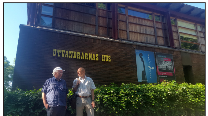
En lille delegation besøgte Udvandrernes hus i Växjö i Sverige for at få inspiration til vores kommende nye museum

Den aktuelle del af det videre forløb er færdiggørelse af rapporter – dvs. trykning i flot layout til brug for ansøgninger. Godkendelse af vedtægter, således at den nye institution kan stiftes. Denne proces foregår i den første halvdel af 2019 – med behandling på Museum Rebilds museumsforenings generalforsamling i marts og for Rebildselskabet, på deres årsmøde i USA, i april måned.