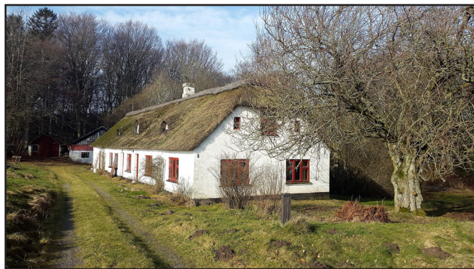
Skørping Holme februar 2019