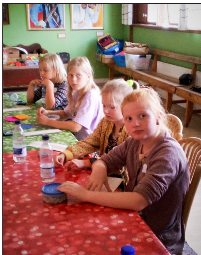
Aktiv ferie for skoleelever fra Mariagerfjord og Rebild kommuner 2021. Der lyttes opmærksomt til fortællinger om udvandrertiden.

I slutningen af juni og starten af august var museet for første gang med i Rebild og Mariager Fjords kommuners tilbud til skoleelever med Aktiv Ferie. Vi kunne tilbyde kreativt værksted, med husflid, som det kunne foregå i Danmark, og som udvandrerne tog med til USA. Der blev bl.a. lavet malke-