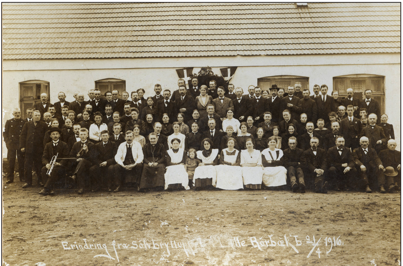
Solvbryllup - Lille Rørbæk 1916 I forreste række spillemand og serveringspersonale.

man traditionerne til langt op i tiden. I andre sog- ne og bymiljøer ændredes festsikke- ne hurtigere og fulgte tidens trend. Der er dog mange beretninger fra Himmerland fra omkring 1. verdenskrig og læn- gere frem, der sagtens kan tangere traditioner, der er optegnet i sidste halvdel af 1800-tallet. Festerne i det gamle landbosamfund havde to vigtige aktører, nemlig skafferen og spillemanden. Skafferen organi- serede mange steder festen eks. et bryllup. Han stod for invitationer til brudeparrets familie og nærmeste venner. Spisning og bordopstilling skulle planlæg- ges, der skulle laves aftaler med kokekone og serve- ringspersonale. I gammel tid blev der ofte afleveret madvarer og naturalier fra naboer og venner til brug for festen, og det skulle der planlægges ud fra. Nogle gange blev der også lånt porcelæn og service hos na- boerne.