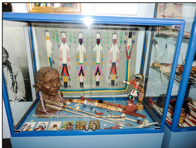
Fra Udvandermuseets udstillinger af indianerkultur.