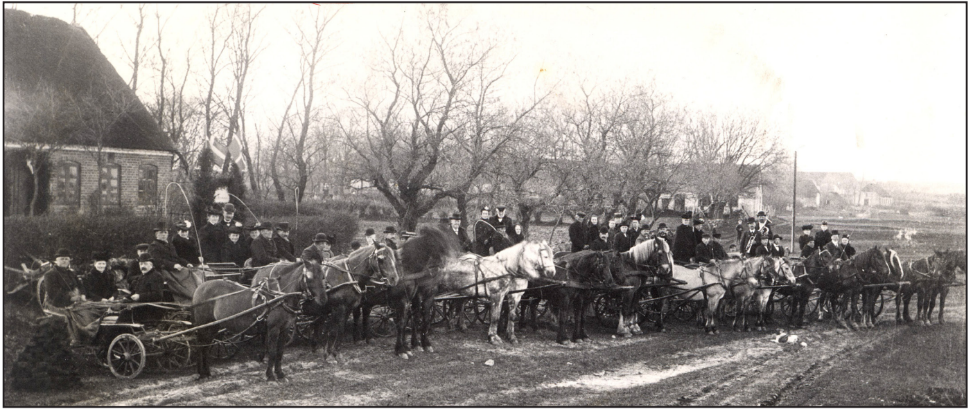
Bryllupsoptog - sandsynligvis sølvbryllup i Volsted syd for Ålborg. Alder uvis, men før 1. verdenskrig.

den. Men på den Tid der her er tale om, for et halvt Århundrede siden, var de en Institution, overleveret fra Fædrene, et Bryllup kunne ikke tænkes, uden enten den ene eller den anden af dem. Hele Musikken bestod af en enkelt Clarinet, senere et Horn, men med det var man allerede inde i en anden Tid. Clarinetten er gammel som Livet på Landet, den går tilbage til den urgamle Skalmje, Hyrdens Instrument, og den klædte Spillemanden anderledes godt, når han gabede vidt og bredt over Mundstykket som en Pan, end Hornet, der gav udblæste Kinder og en presset anstrengt Stilling”.