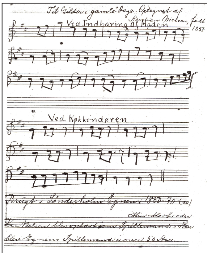
bryllupsfesten i Sønderholm i 1863.