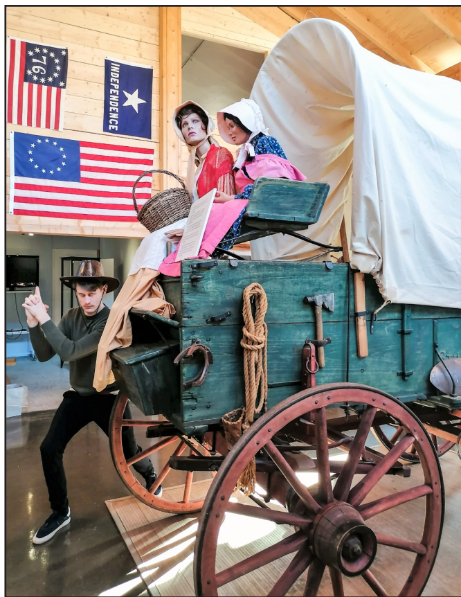
Fra Udvandermuseet - Prærievognen - lavet på Studbaker fabrikkerne