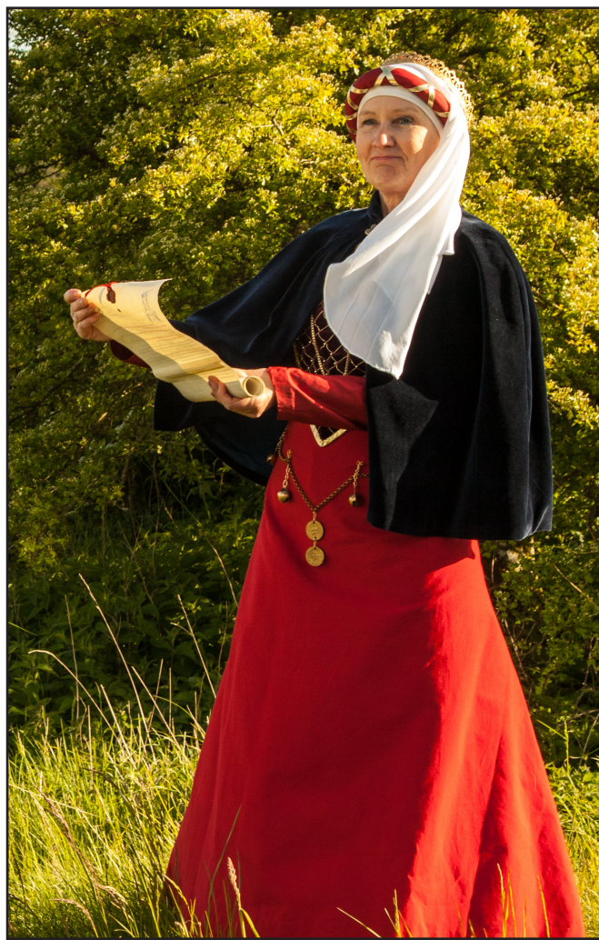
Fra 100 dages arrangement 2021 - Middelaldertoner og Ballader. Dronning Margrethe d.1. fortæller på borgen Egholm.

Næste arrangement fandt sted en helt fantastisk lun sensommeraften den 25. august og tog udgangspunkt i Egholmborgen i Skørping Holme. – en middelalderevent, hvor vi var tilbage i 1300-tallet. Der