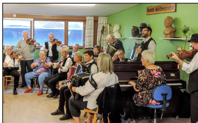
Museum Rebilds 70 års jubilæumsarrangement. Spillemændene giver koncert.