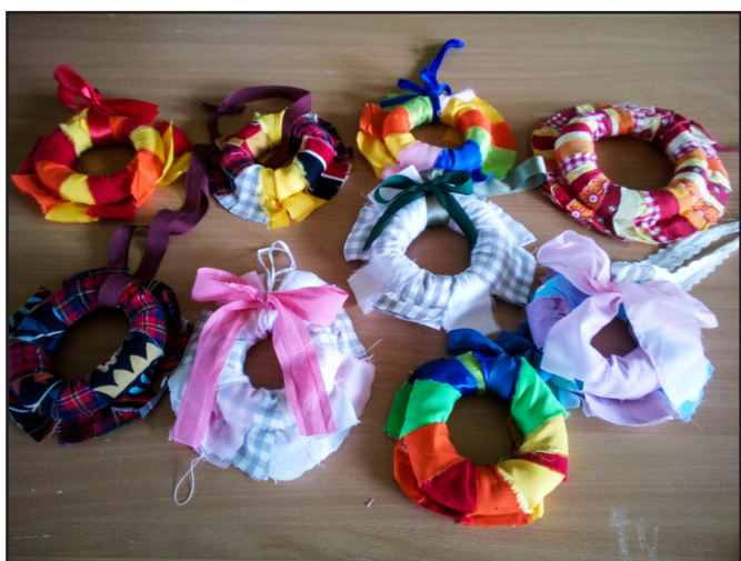
Aktiv ferie for skoleelever fra Mariagerfjord og Rebild kommuner 2021. Børnene har lavet flotte metalkranser