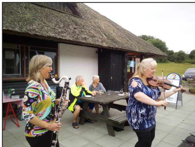
Gruppen Apinaja præsenterer deres ny CD-plade.