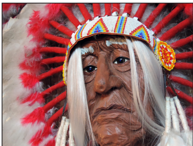
Indianerhøvdingen i Udvandermuseet.

Der har i 2022 været voksende interesse for Det Danske Udvandermuseum, som er placeret i Rold høj bygningen, med direkte adgang fra Museum Re-