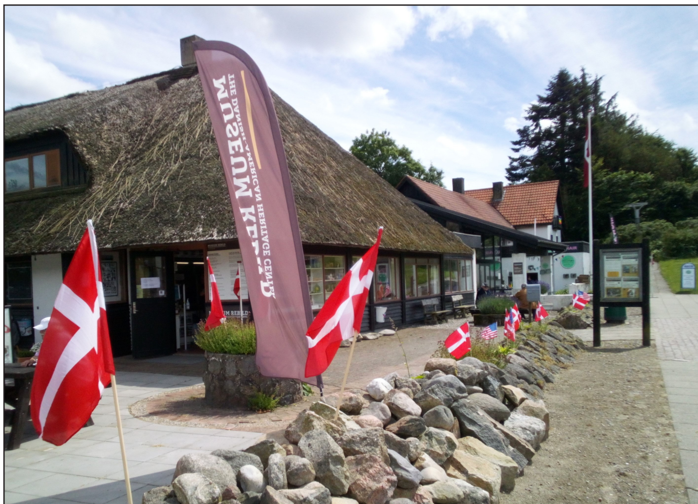
Museum Rebild markerer Rebildfesten den 4. juli.