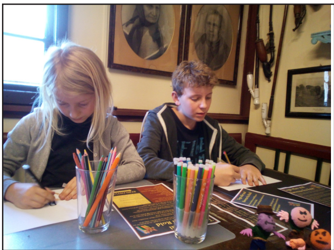
Der tegnes "røvere".

Ellers indeholder årets gang de faste arrangementer på museet, med Søndagsdans, Onsdagsspillemænd, Rebildkvadrillens folkedansere og seniordans. Årets folkemusiktræf blev afviklet på Kulturstationen i Skørping med stor tilslutning af spillemænd og dansere. Det er dejligt at opleve at museet rummer både formidling af kulturhistorien, men også er hjemsted for aktiviteter, der samler mange mennesker og interesseområder.