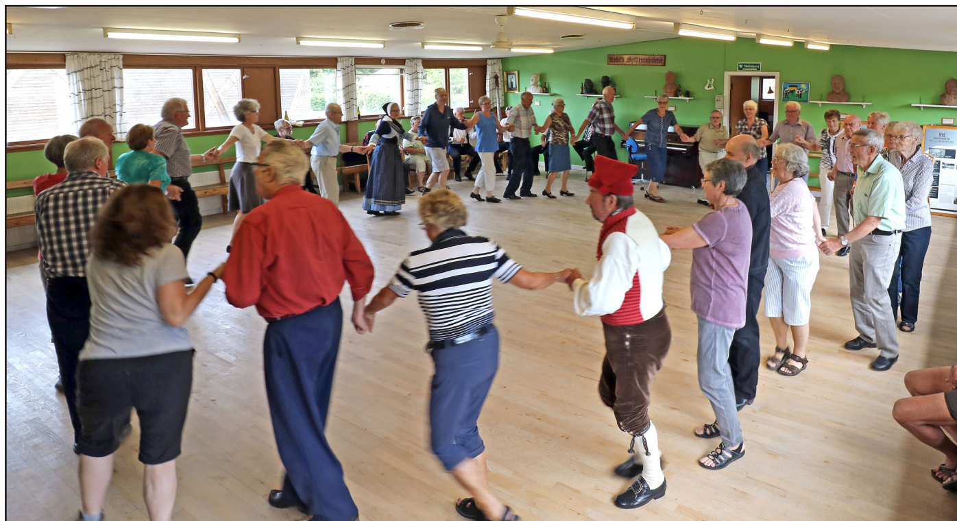
Søndagsdansen. Levende himmerlandsk folkemusiktradition.